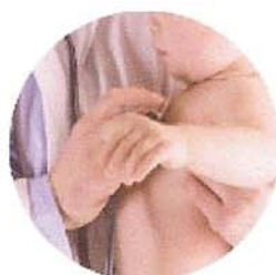
MMG (Medico di medicina generale) e Pediatra di libera scelta